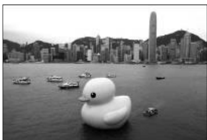
(1) 在海港城對出黃色巨鴨