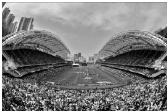
(3) 香港國際七人欖球賽