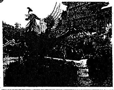
廣場中央：一隻菊花砌成的「鳳凰」