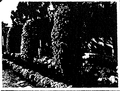
入口：許多朵菊花砌成的「樹」